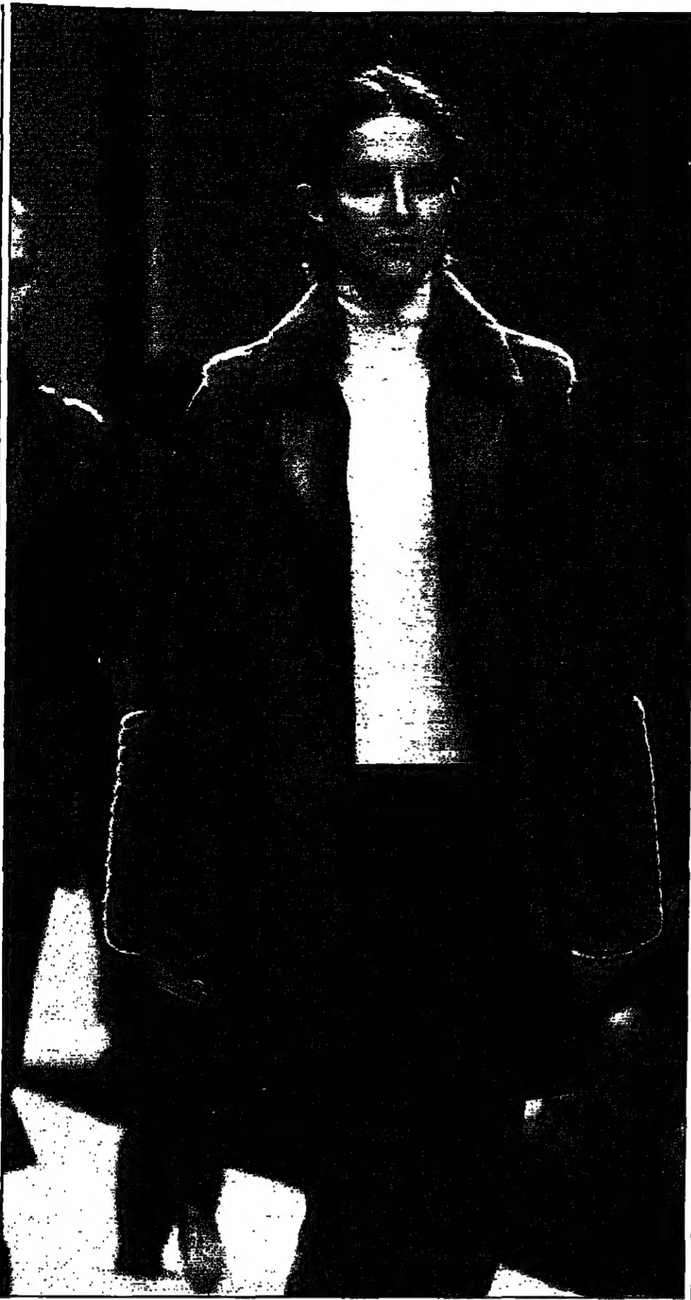
أحدث مبتكرات نازارينو فابرياني لوسم الشتاء المقبل قدمها في ميلانو أمس الأول

القاهرة - مكتب «القدس العربي» - لحدث وقائع قيام الشعوذين والمجانين بالاعتداء الجنسي على ضحاياهم كانت في مدينة شبراخيت اليوم عاصمة محافظة المنوفية - ويطلقها ممرض سابق، والضحية طلبة بالترسة الثانوية من محافظة أخرى - هي فكر الشيخ. فقد استقال من عمله بالتدريس، بعد ان وجد ان الشعوذة تجلب عليه ربحاً أكثر من للتدريس، لهذا الغرض ويبدأ يمارس لهفته في شقة استأجرها، لهذا الغرض وسرعان ما ناع صوته، وعثر زميلته التي اخذها باتون اليه من محافظات أخرى باعتبار انه وصل مبروك لمرجة بفت لحدى الأبحاث في محافظة على الشيخ التي ان تاتي اليه ومعها شقيقها وابنتها الطالبة بالترسة الثانوية لتخطب، منه ان يعالجها من مرض في ساقها بدلاً من عرضها على الطبيب. وبعدت التلميذة الى حجرة الرجل المبروك الذي طلب منها التفرغ من ملباسها تماماً لاجراء المعرفين من